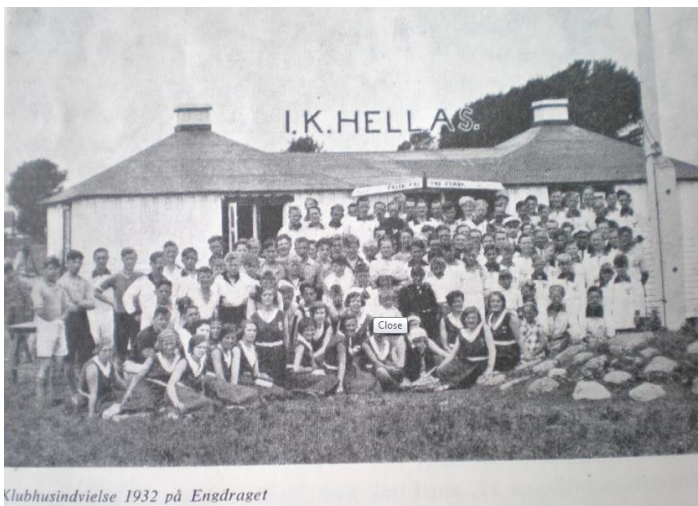
Clubhusindvielse 1932 på Engdraget

I 1942 blev det nye klubhus, som var meget tiltrængt indviet og det var et rigtig moderne et af slagsen med brusebad mm. På indvielsesdagen var der arrangeret et venskabskamp hvor et blandet BK Hellas og Vanløse mandskab tog imod Frem for øjnene af hele 1200 tilskuere på Engdraget. Kampen blev 3-3. I A-rækken opnåede man i 1942 også det indtil nu bedste placering som nr. 2. Det gode spil fortsat de mange efterfølgende år, hvor man frem til 1949 altid sluttede mellem nr. 2-5 i A-rækken.