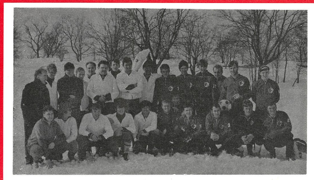
Træningskampen mod vore svenske venner fra Svenljunga