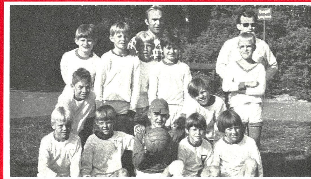
HELLAS putterne der har opnået meget fine resultater i forårsturneringen.