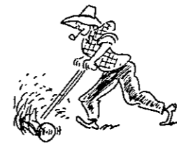
»Chriss« på weekend

Vi startede i år træningen den 12. januar med mønstring af 1. og 2. holdstruppen i Søndermarken. Da første turneringskamp først skulle spilles den 6. april lagde vi ud med 2 gange træning om ugen. Dette fortsatte indtil 5. marts, hvor træningen intensiveredes. Vi gik da over til 5 gange ugentlig træning med afsluttende træningslejr i Knabstrup 21., 22. og 23. marts. Det generelle indtryk af træningskampene har været tilfredsstillende, dog manglede endnu den rette sammenkobling af kæderne, for at topresultaterne skal komme. Til trods for den hårde træning spillerne er udsat for, hersker der en fin ånd og et godt kammeratskab. Begge meget væsentlige ting, som vi får brug for i den kommende sæson. Jeg håber og tror, at begge hold vil komme rigtigt ud af starthullerne, når vi lægger ud i den nye turnering.