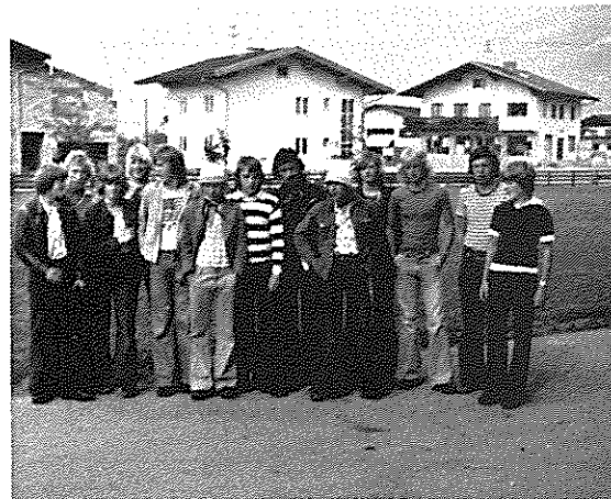
Deltagerne på Østrigsturen: